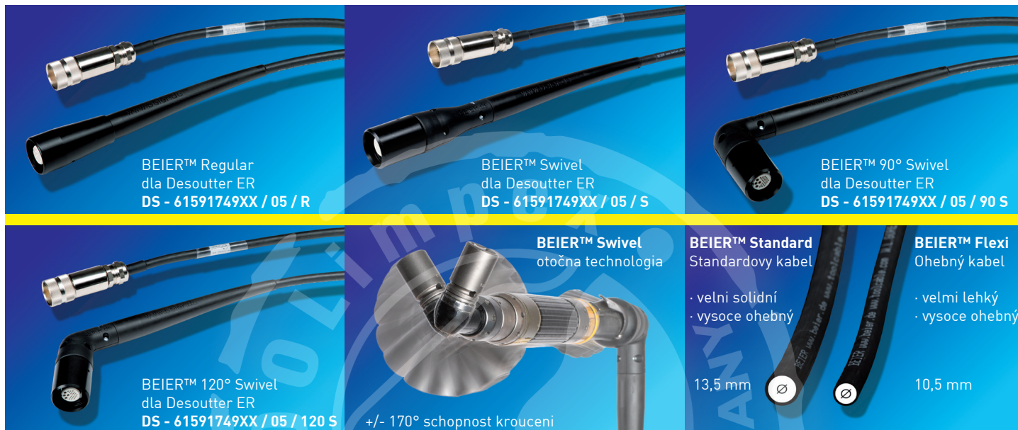
BEIER™ Regular dla Desoutter ER DS - 61591749XX / 05 / R

Náhrada dla čísel DESOUTTER / CP GEORGES RENAULT: 61591749XX / 61591757XX / 61591707XX